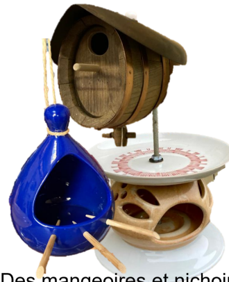
Des mangeoires et nichoirs à partir de vaisselle

Sinon, il peut arriver que nous jetions des objets qui ne se vendent vraiment pas. Après plusieurs mois dans le magasin, en baissant le prix, on ne peut pas les garder indéfiniment.