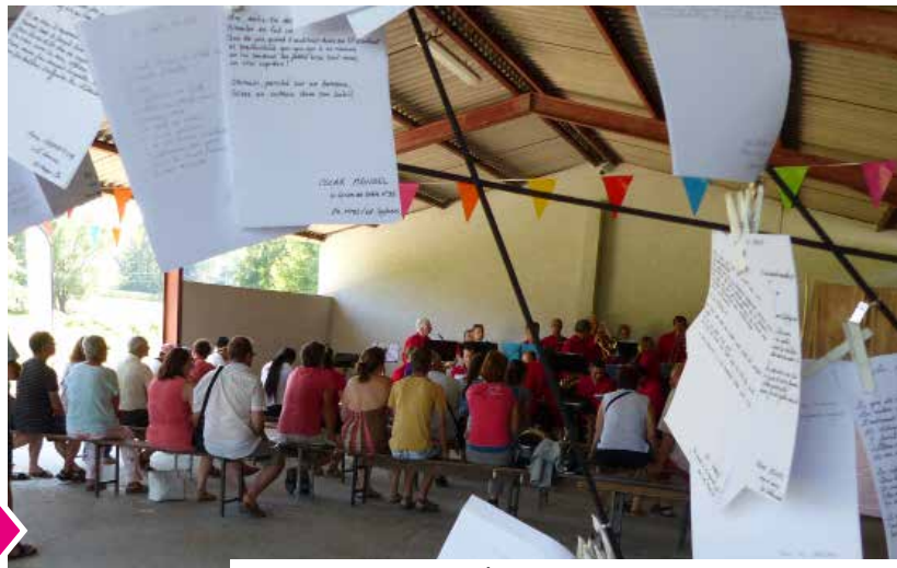
► Jour de fête - Organisé par la Cie Autochtone en juin 2017

Ces interventions artistiques seront précédées par une petite évocation du patrimoine afin d'apporter un éclairage historique sur les lieux.