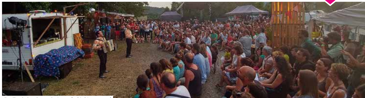
▼ Festival «les Sons du Lac» à Châteauneuf

Rendez vous du 6 au 8 Juillet 2018 au bord du lac de Châteauneuf avec la joyeuse et sympathique équipe de bénévoles qui vous accueillera chaleureusement pour une nouvelle édition colorée, éclectique et originale.