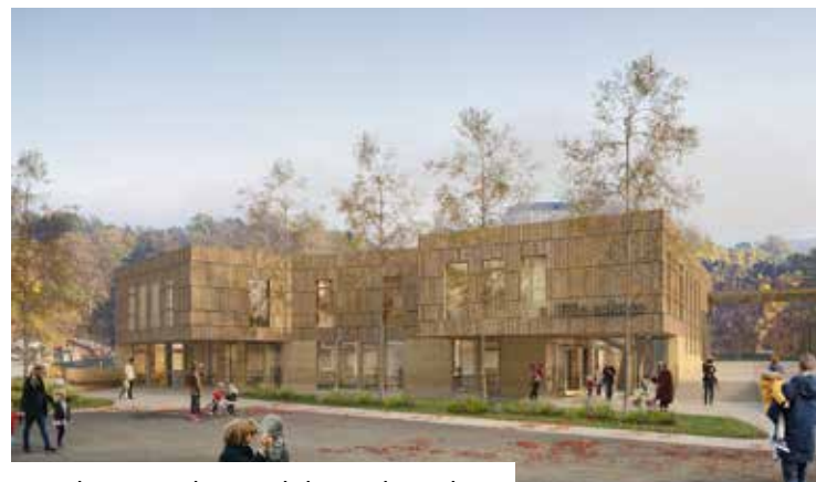
Vue du parvis d'accueil depuis le parking

Ce pôle enfance est une des briques d'un projet global de « pôle famille » sur le secteur de La Seytaz, porté conjointement par la commune et la Communauté de communes.