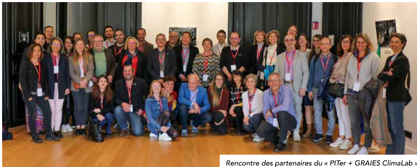
Rencontre des partenaires du « PITer + GRAIES ClimaLab » le 11 avril 2024

Après plusieurs expériences de coopération transfrontalière réussies, la collectivité s'engage, cette année, aux côtés de 10 partenaires français et italiens dans un nouveau programme pluriannuel, le Plan Intégré Territorial : « PITer + GRAIES ClimaLab ».