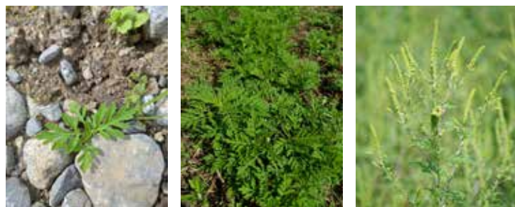
Les différents stades végétatifs de l'ambroisie

Regardez également autour des mangeoires à oiseaux, les sachets de graines commercialisées contiennent parfois des graines d'ambroisie.