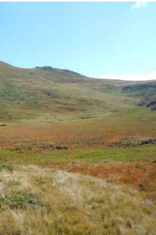
Alpage du Plan - Le Verneil