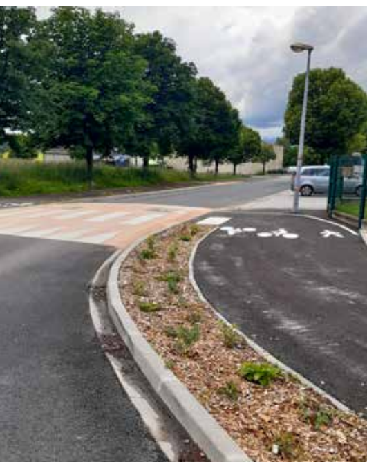
Zone d'activités de Carouge

Le besoin d'aide et d'accompagnement dans la réalisation des démarches administratives dématérialisées ne cesse de progresser en France. France services est une réponse parmi d'autres, proposée aux habitants de Cœur de Savoie, à travers ses deux antennes de Valgelon-La Rochette et Saint-Pierre d'Albigny, et ses permanences de proximité à Chamoux-sur-Gelon et Montmélian.