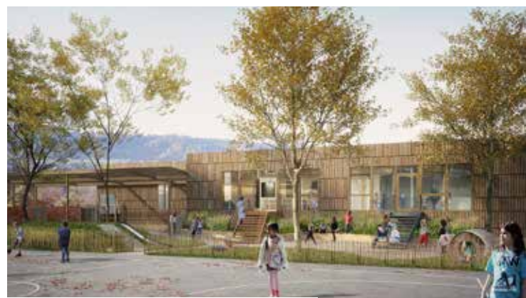
Vue de la cour depuis le plateau sportif