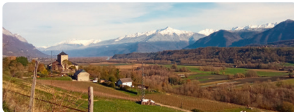
LE DOMAINE DU CHÂTEAU DE LA RIVE AVEC AU FOND LE GRAND ARC (2484 M)

Continuer sur D201 au hameau la Baraterie.