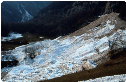
NÉVÉ DE PLAN CRUET