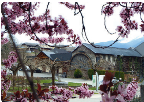
LA GRANDE ROUE