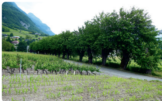
LE CHEMIN DES MÛRIERS