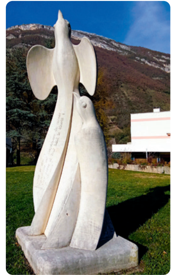
PLACE ALBERT SERRAZ

Centre administratif communal, Place Albert Serraz du nom du maire (1947-1977) et conseiller général (1949-1973).