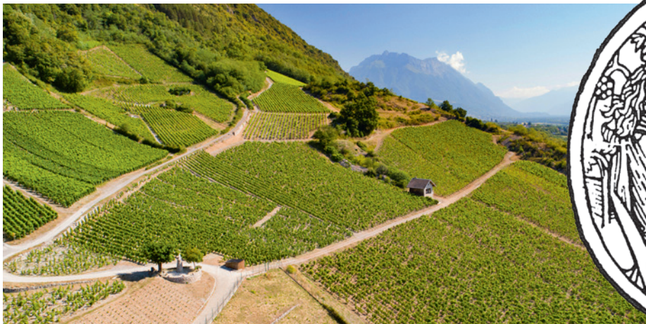
LE VIGNOBLE D'ARBIN

Ici, la vigne produit très bien et depuis très longtemps. Des auteurs tels que Pline et Columelle en font déjà état au 1 er siècle avant J.C. Depuis et jusqu'à notre époque contemporaine, ce fut la création puis, après les ravages du phylloxéra, la renaissance du vignoble savoyard par la mise en valeur des procédés de culture, la quête de la qualité. Ce terroir historique est donc un espace représentant la conjonction d'un sol, d'un climat donnant ainsi un caractère unique au raisin récolté et aussi du travail des vignerons gardiens du temple.