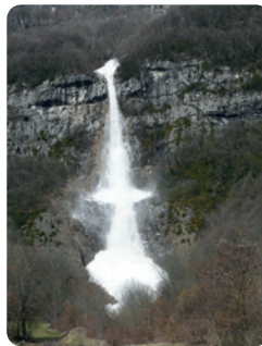
AVALANCHE DE PLAN CRUET